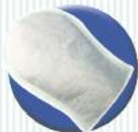
aqua ® Curațare fără clătire