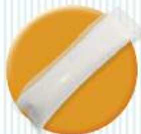
GelMax ® Superabsorbant