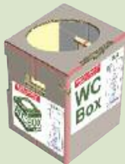
Kit de toaletă gata de folosire

Aceste solutii sanitare sunt igienice, ecologice, economice și practice.