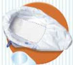
CareBag ® Pungi absorbante